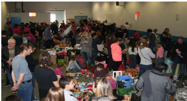
Grandes Puces Enfants

Avec l'aide du CMJ et le soutien de la ville de Baillargues, le GPE a organisé son 4ème marché aux puces réservé aux enfants. 50 apprentis vendeurs ont connu leurs 1ères expériences de vente