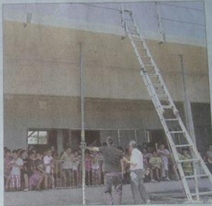
■ Le GPE et Céladonie impliquent les élèves dans le chantier de l'école Antoine-Geoffre.

L'association parentale a donc voulu donner du contenu aux notions complexes de