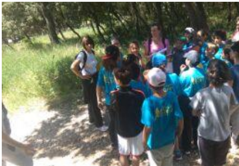
Initiation C.O. classe CM2